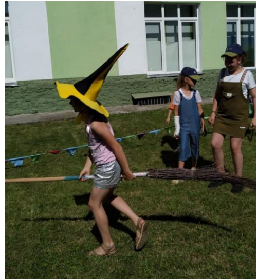
Капитан команды на метле