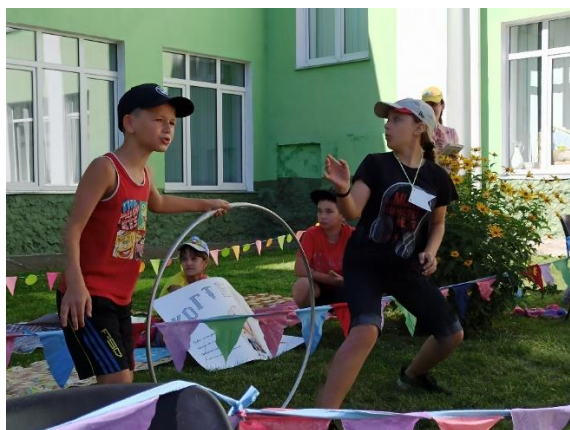
Кольцо-ворота, вратарь и защитник